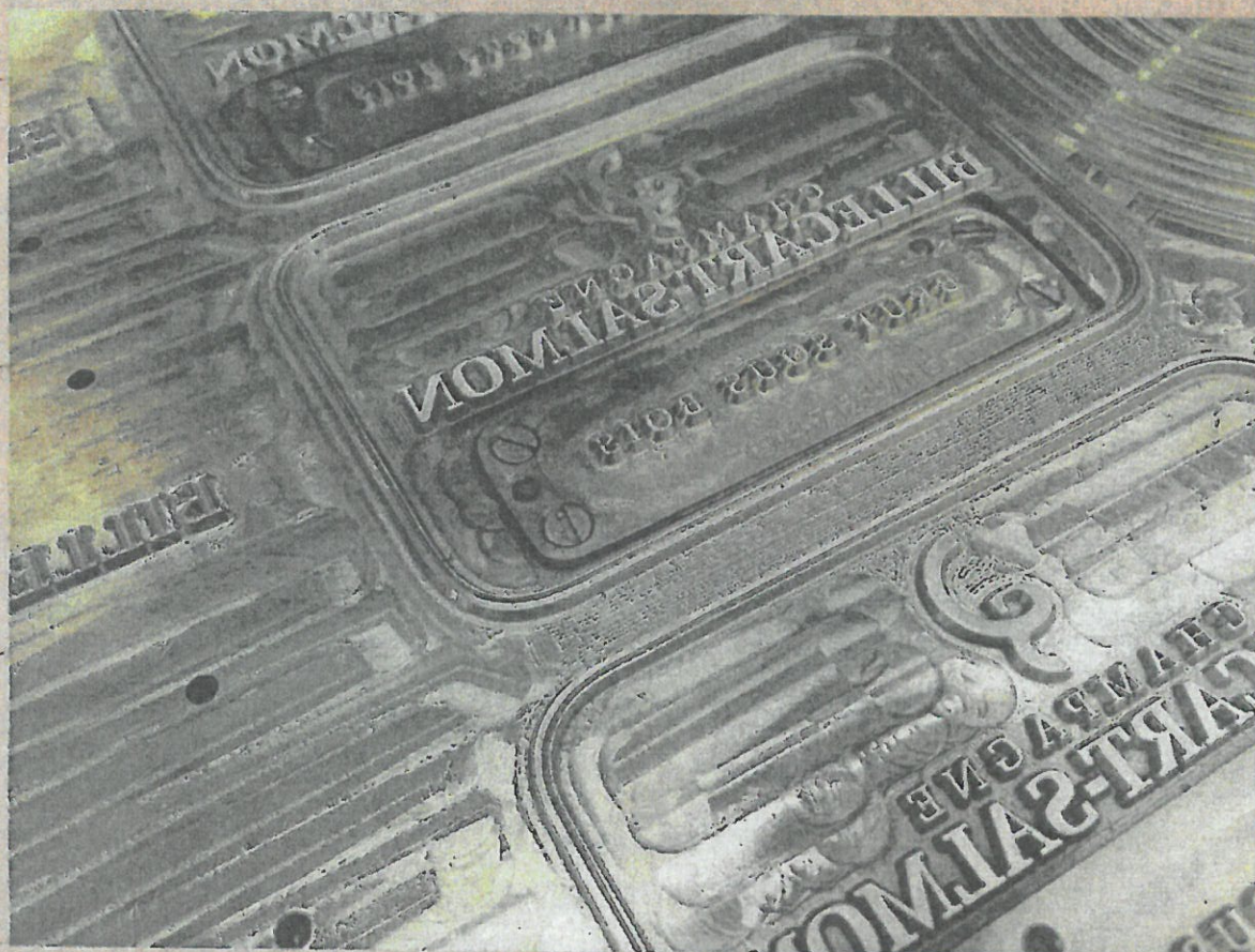
Des durures, des reliefs, des puces connectées : l'étiquette se pare de 1 001 astuces pour livrer ses informations.

Les marques de champagne recherchent plus de technicité et d'authenticité pour habiller les bouteilles.